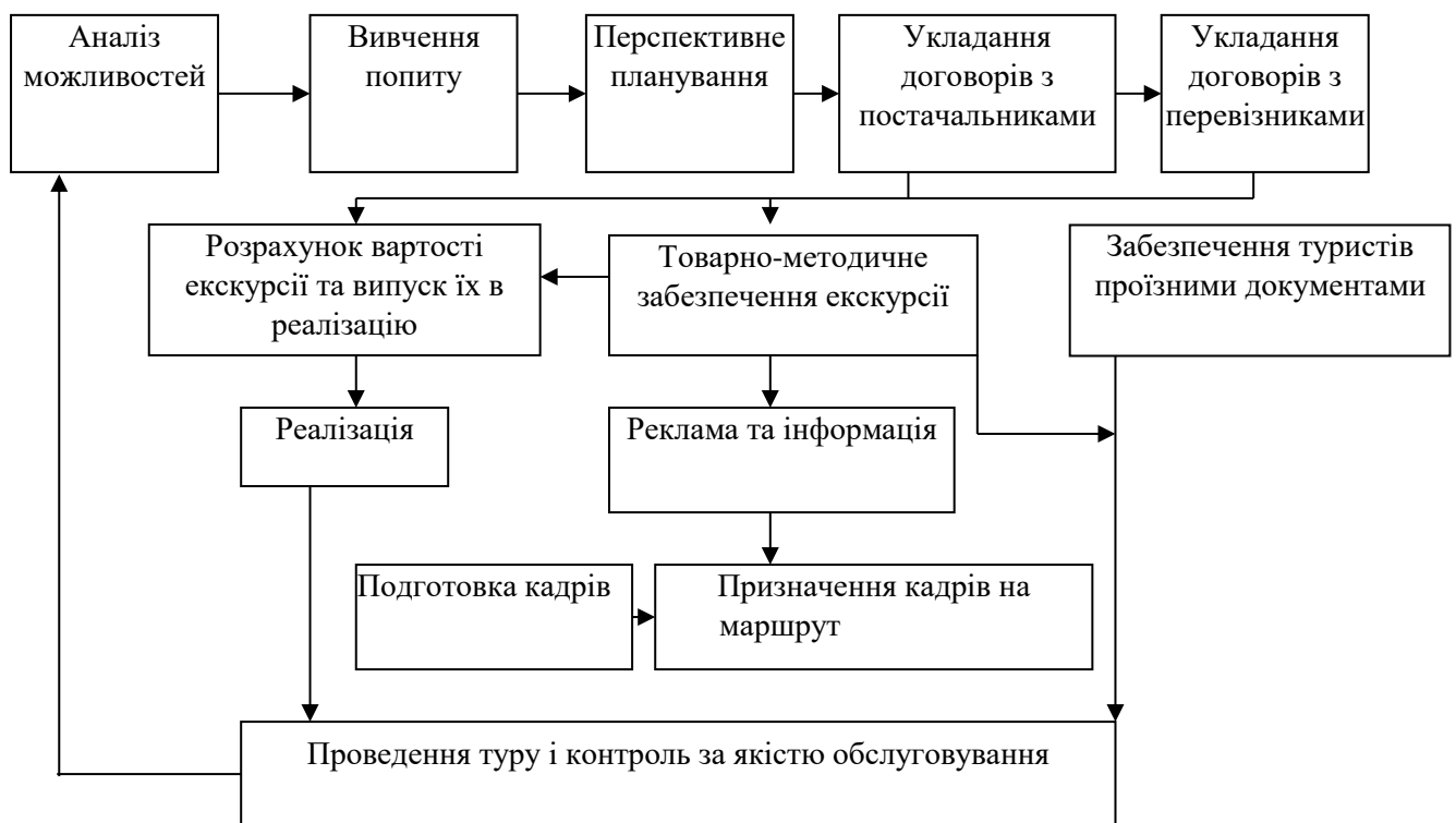
Рис. 3.1 - Етапи організації роботи туристського підприємства по розробці туру

З метою залучення екскурсантів щорічно розробляються якісно нові екскурсії з включенням нетрадиційних компонентів – мультимедійних роликів, фільмів у тривимірному вимірі. Показ експозиції нерідко завершується виходом із музею для огляду довколишніх цікавих архітектурних, історичних чи природних об'єктів тощо.