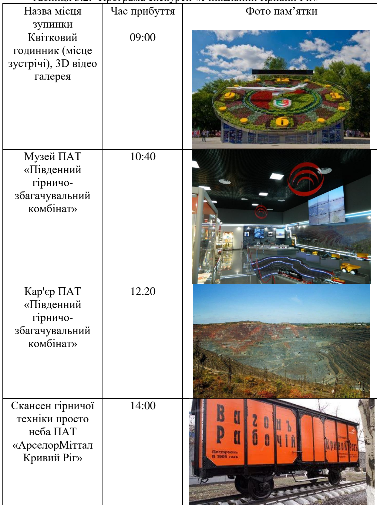
Таблиця 3.2. -Програма екскурсії «Унікальний Кривий Ріг»

Надамо програму екскурсії «Унікальний Кривий Ріг» (табл. 3.2.).