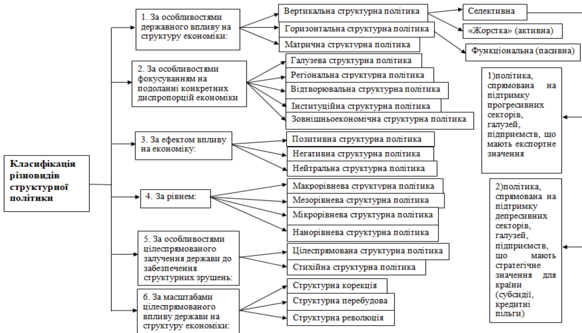
Рисунок 1- Класифікатор різновидів структурної політики