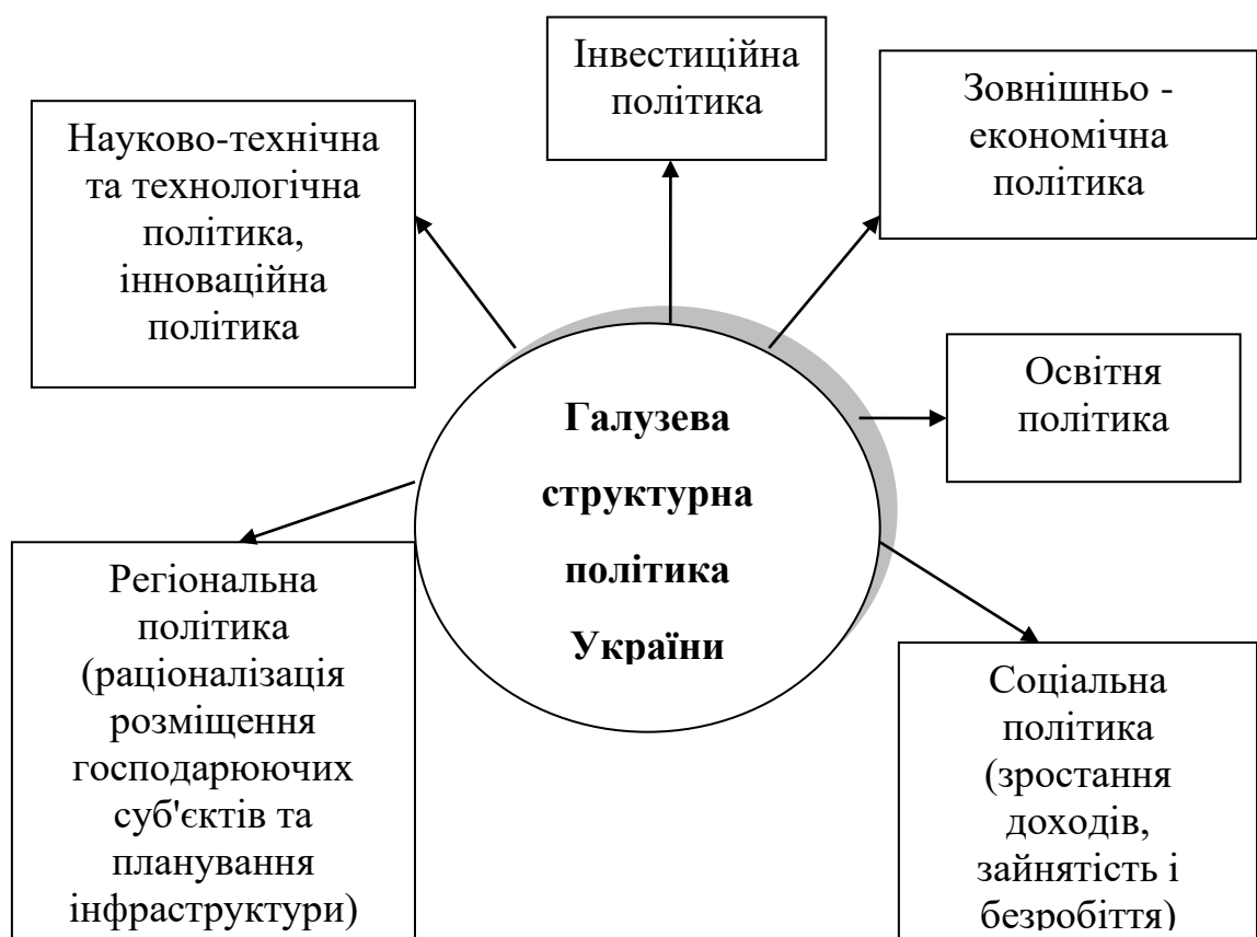
Рисунок 2– Зв'язок структурної політики із іншими напрямками соціально-економічної політики держави

Як зазначає Комарницький І.Ф., структурна політика здійснюється через інструменти інноваційної, інвестиційної, науково-технічної політики, «політика прискореної амортизації, субсидії, державна допомога окремим фірмам чи галузям, державне регулювання норми процента, державна закупівля продукції, податкова політика тощо» [45]. Аналогічних поглядів дотримується й Штань М.В., стверджуючи, що структурна політика має бути узгоджена «...з основними елементами інвестиційної, промислової, соціальної та зовнішньоекономічної політики держави. Лише за умови комплексного підходу до вирішення зазначеної проблеми можливим є досягнення стратегічної мети державного регуляторного впливу» [46]. При цьому, як зазначає Луцков В. О., «Як окрема складна система, структурна політика має ще й певні властивості: цілісність (жоден елемент структурної політики не може бути усунений, модифікований або доданий із порушенням структурної повноти системи), неадитивність (результати спільного впливу двох елементів структури не тотожні сумі результатів впливу цих елементів окремо), структурність (можливість декомпозиції на компоненти, елементи та встановлення зв'язків між ними), ієрархічність (кожен компонент структурної політики може розглядатися як система (підсистема) більш широкої глобальної системи)» [2]. Взаємозв'язок структурної політики та іншими напрямками соціально-економічної політики держави подано на рис. 2.