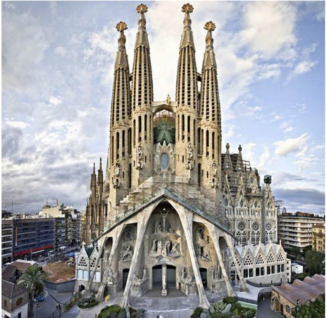
«Собор Святого Сімейства. Барселона»

URL: https://decorateme.com/articles/remont-materialy/khram-sviatogo-semeisterva-antonio-gaudi-96