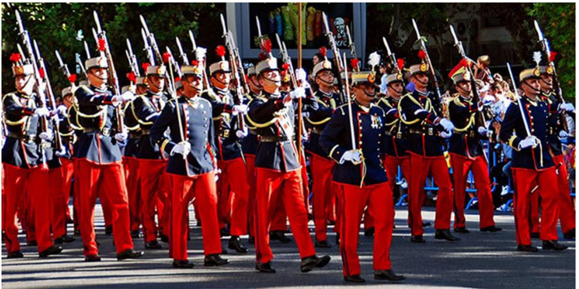
«Воєний парад по бульвару Кастельяна у честь національного свята – Іспанідад»

URL: https://espanarusa.com/ru/pedia/article/71580