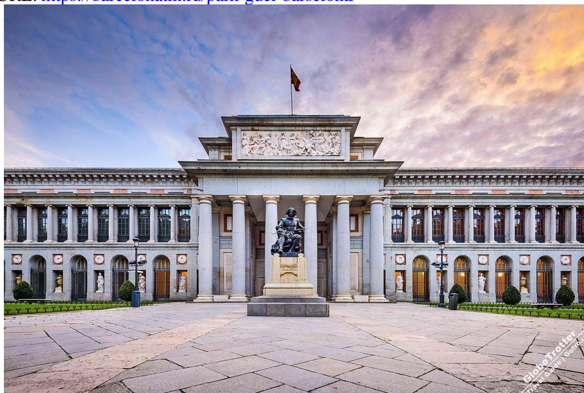
«Музей Прадо. Мадрид»

URL: https://barcelonatm.ru/park-guel-barselona/