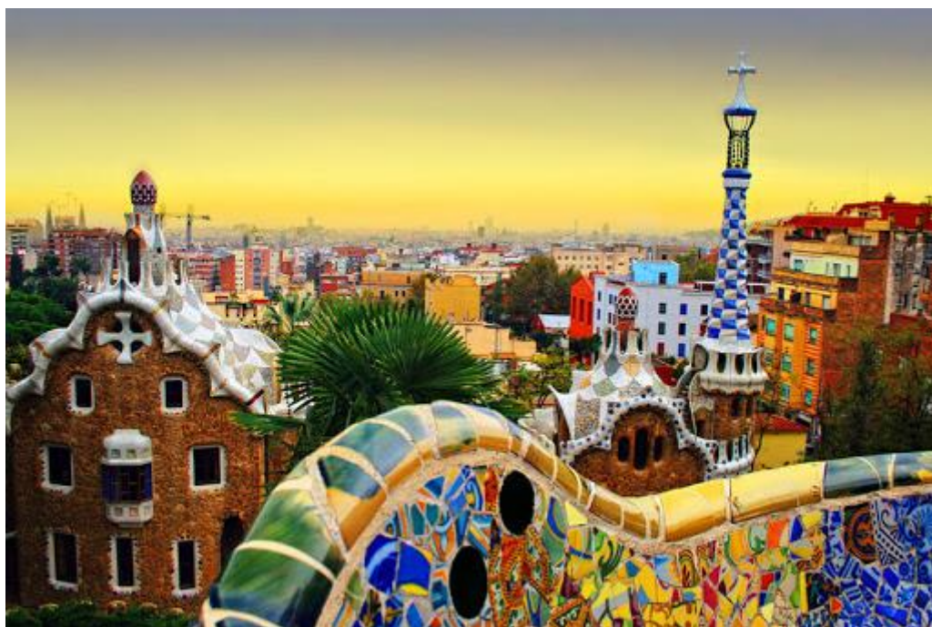
«Парк Гуеля. Барселона»

URL: https://barcelonatm.ru/park-guel-barselona/