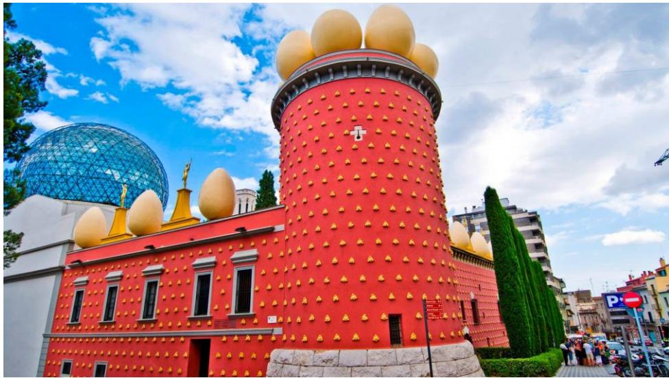
«Театр-музей Сальвадора Далі. Барселона»

URL: https://espanarusa.com/ru/pedia/article/71580