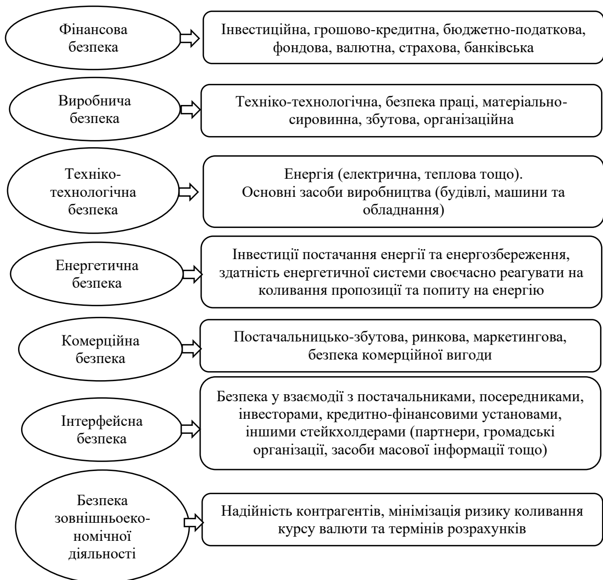
Рисунок 1.1 - Складові економічної безпеки підприємств

Особливістю й, одночасно, складністю при побудові системи економічної безпеки є той факт, що її дієвість практично повністю залежить від людського чинника. Навіть при наявності на підприємстві професійно підготовленого начальника служби економічної безпеки, сучасних технічних засобів, менеджмент підприємства не отримає бажаних результатів доти, поки у колективі кожний співробітник не усвідомить важливість і необхідність впроваджуваних заходів економічної безпеки. Схематично основні складові економічної безпеки підприємства подано на рис. 1.1.