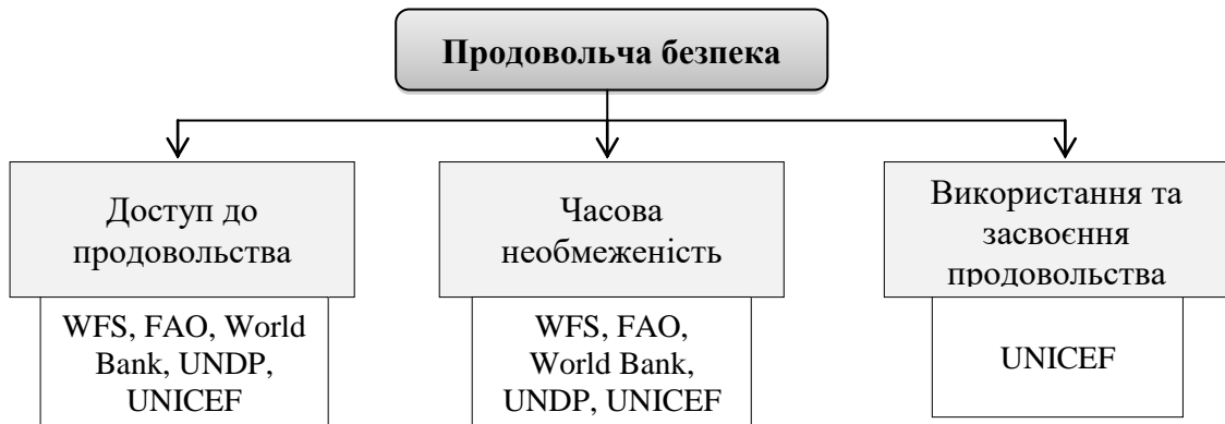
Рисунок 1.1 – Визначення міжнародними організаціями чинників, які впливають на рівень продовольчої безпеки

Встановлення чинників, які впливають на рівень продовольчої безпеки, є досить складним науковим завданням в зв'язку з перманентною зміною зовнішнього середовища, зростанням уваги до забезпечення індивідуальних потреб особистості. Детальний аналіз нормативних документів міжнародних організацій дозволив згрупувати існуючі підходи та виокремити три головних типи чинників, які впливають на рівень продовольчої безпеки (рис. 1.1).