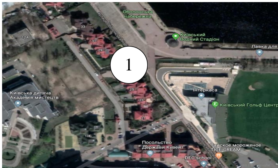
Рис.2.1. Місце проєктування нового закладу ресторанного господарства в Оболонському районі м. Києва по вул. Оболонська набережна 27 а

Проектований заклад ресторанного господарства планується спроектувати по вулиці Оболонська набережна, 27а, де є вільна ділянка під будівництво закладу (рис.2.1).